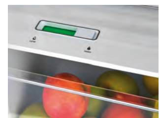
Regler zur Feuchtigkeitskontrolle